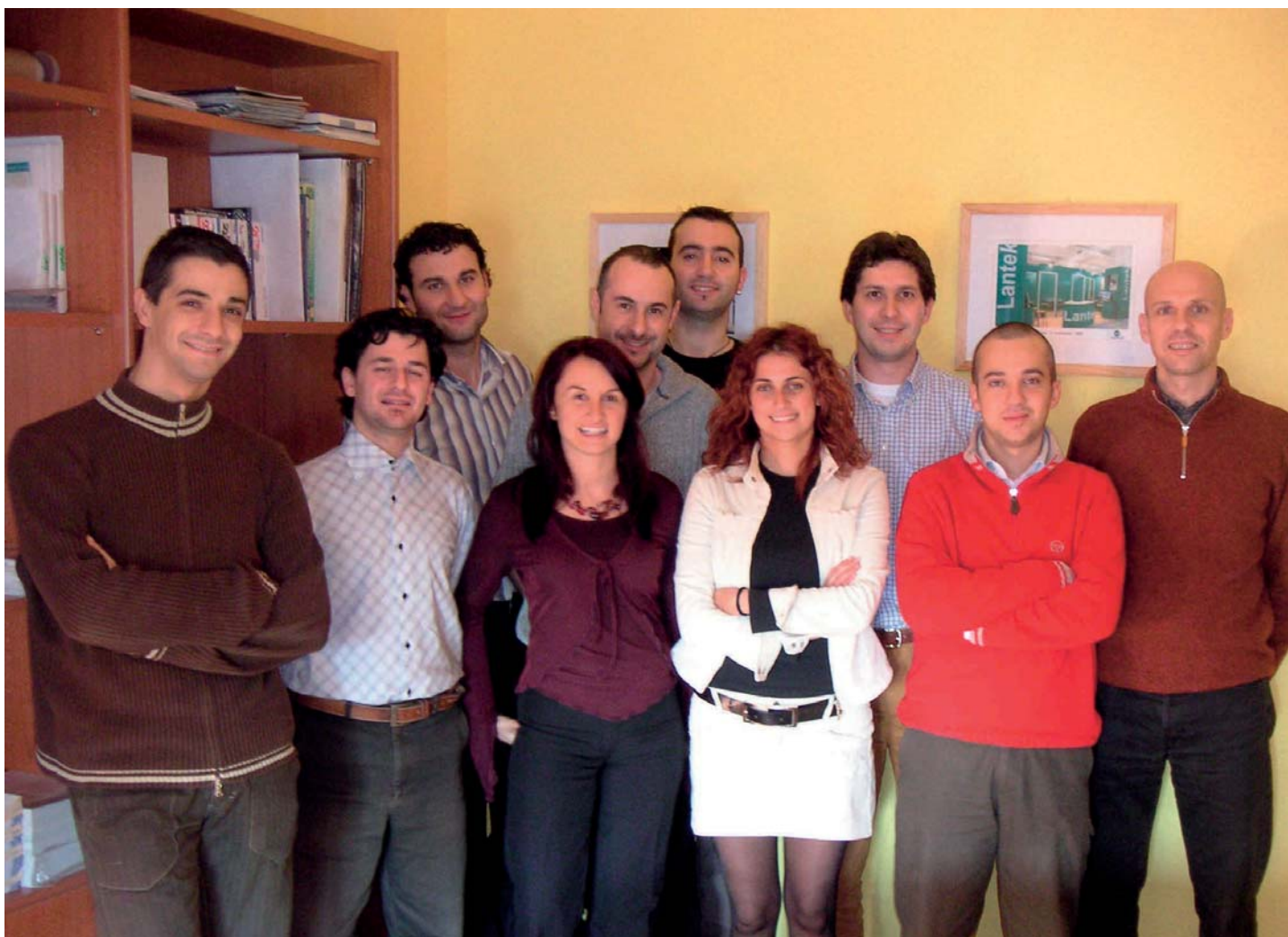
Team Lantek Sistemi

Una squadra in piena crescita dunque, che investe in formazione ed aggiornamento, e ritiene che, in un mercato così competitivo, la professionalità delle persone possa fare la differenza per meritare la stima e la fiducia dei clienti.